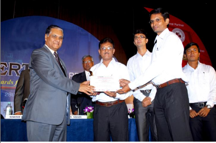
શ્રી આર. વી. શાહી, ભૂતપુર્વ સેક્રેટરીશ્રી, પાવર-ગર્વમેન્ટ ઓફ ઈન્ડીયાના વરદ હસ્તે "ENERTIA-2009" એવોર્ડ સ્વીકારતા કાર્યપાલક ઈજનેરશ્રી (રૂનેજ) સહિત સુરત મહાનગરપાલિકાની ટીમ

એવોર્ડસ (૫) મોસ્ટ ઈન્વેસ્ટમેન્ટ ફ્રેન્ડલી સ્ટેટ ફોર એનર્જી એન્ડ પાવર એવોર્ડ પૈકી કેટેગરી-૨ પાવર જનરેશન એવોર્ડસ - મ્યુનીસીપલ એનર્જી કેટેગરીમાં ભાગ લેવા માટે સુએઝ ટ્રીટમેન્ટ પ્લાન્ટની પ્રોસેસ દરમ્યાન ઉત્પન્ન થતાં બાયોગેસનો ઉપયોગ કરી આંજણા, ભટાર, કરંજ અને સિંગણપોર સુએઝ ટ્રીટમેન્ટ પ્લાન્ટ ખાતે બાયોગેસ આધારિત ૩.૫ MWe ક્ષમતાના પાવર પ્લાન્ટ ધ્વારા ચીન એનર્જી/ઈલેક્ટ્રીસીટી ઉત્પન્ન કરી સુએઝ ટ્રીટમેન્ટ પ્લાન્ટને ઈલેક્ટ્રીસીટી પૂરી પાડવાના પ્રોજેક્ટ માટે સદર એવોર્ડમાં ભાગ લેવામાં આવેલ હતો. સદર ચારેય પ્લાન્ટ મળી આજદિન સુધી ૧,૯૭,૦૦,૦૦૦ યુનિટ ઈલેક્ટ્રીસીટી ઉત્પન્ન કરવામાં આવેલ છે, જેને પરિણામે સુરત મહાનગરપાલિકાને આજદિન સુધી કુલ્લે રૂ. ૮,૫૦,૦૦,૦૦૦/- ની વીજ બચત થયેલ છે.