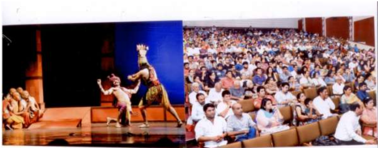
સાચા અર્થે આ કાવ્ય, તથા શિલ્પી અને મુદ્રા સારવજીવિયાના સહયોગે ઉત્પાદન કરવામાં આવેલ છે. આ કાવ્ય, આજના સમયની સાચી ઉત્ક્રાંતિ છે. આ કાવ્યની મૂલ્યવાન ભૂમિકા છે. આ કાવ્યની મૂલ્યવાન ભૂમિકા છે. આ કાવ્યની મૂલ્યવાન ભૂમિકા છે.

સાચા અર્થે આ કાવ્ય, તથા શિલ્પી અને મુદ્રા સારવજીવિયાના સહયોગે ઉત્પાદન કરવામાં આવેલ છે. આ કાવ્ય, આજના સમયની સાચી ઉત્ક્રાંતિ છે. આ કાવ્યની મૂલ્યવાન ભૂમિકા છે.