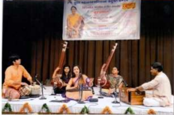
રાજકોટ શુભ, સોનેલિય માર્કેટ પે.સી. આંગણવાડી-જાન્યુઆરી-૧૯૯૨માં જન્મેલો નિખિલે જી.કે.વેંકટેશ્વરન ડેન્સ સોજી ગુરુવરને સાથે સંગીત શાળા ખુલાવી, વાદ્યોનયન અને શુભ પદાભિષેકવિકાસ સંસ્થા દ્વારા યોજાયેલ સંસ્કૃતિ સંમિલન અને સંગીત-નાચ સામગ્રી સંગ્રહ સમયે "સુખાચલ" જે ટીપ્પણમાંથી શુભાર્થમ કરાવતા સ્વયં આઈ સેરાના કોર્ટેજમાંથી શ્રી પદાભિષેકમાં ગાયત્રી કાવ્ય સ્વાસ્થીય સોનેલિયમાં વેઈટ-ટીંગ અભ્યાસ પ્રક્રિયા સમયે શુભાર્થમ વિદ્યાલય અને સંગ્રહીત સંસ્થાઓના સહયોગે થયું. શિલ્પક, ગુરુવર સાથે સંગીત શાળા ખુલાવીને અભ્યાસી સંગ્રહમાં ગાયત્રી, સ્વાથી સમિતિ અભ્યાસી સંગ્રહમાં દેશકર્ત, સ્વાસ્થ્ય સેવાથી વિદ્યાર્થકાર વિભા, સાંસ્કૃત સમિતિ અભ્યાસીથી સુખાચલ શાળા સંગ્રહ પ્રમુખ અને સ્વાસ્થ્ય સંગ્રહમાં સમયે થયું.