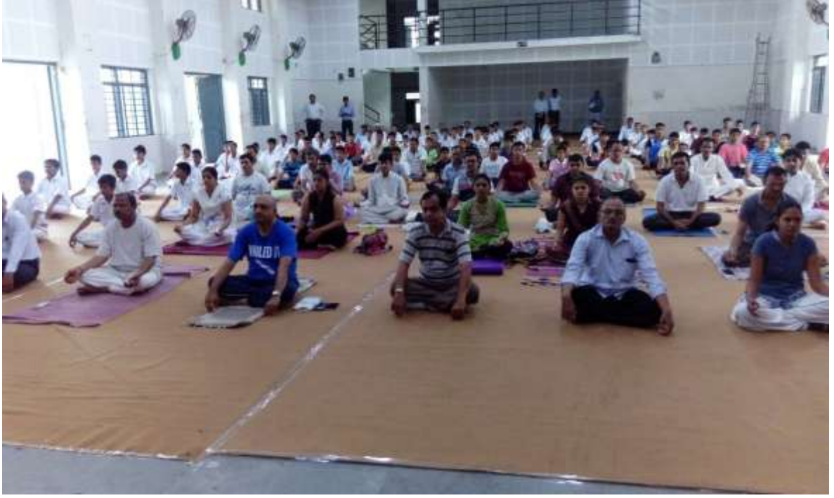
તાલીમ સેશન દરમ્યાન તાલીમ લેતા નગરજનો